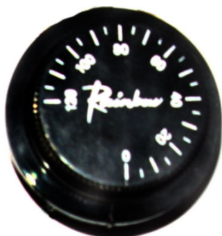
Рис. 1 Регулятор температуры.